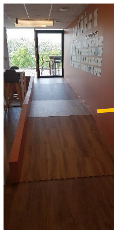
Rampe PMR accès terrasse